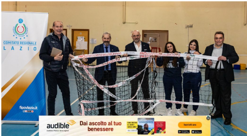
La polisportiva Roma 7 di Centocelle dice no alla violenza sulle donne con un gesto simbolico - Gaeta.it