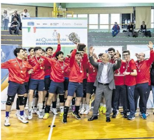
UNA FESTA La squadra maschile di Roma, vincitrice in finale contro Viterbo