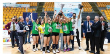
Il Da Vinci di Maccaresse in festa dopo la vittoria sul Vivona

Il Da Vinci di Maccaresse ha messo a segno la sua personalissima doppietta, vincendo un nuovo titolo dopo il primo trionfo nello Junior Maschile dello scorso anno. Sfuma, invece, il tris del Vivona, campione in carica nella categoria. «Siamo andati oltre le più rosee aspettative e abbiamo fatto un gran lavoro di squadra. Le ragazze si sono sempre allenate e la nostra organizzazione in campo si è vista. Abbiamo giocato il primo set in modo perfetto, mentre nel secondo sono salite loro e ci hanno messo in difficoltà. Riagganciate sul 21-21, poi abbiamo chiuso 25-23. È una grande soddisfazione personale