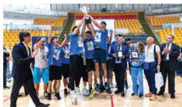
La festa dell'Enriques per un trionfo che mancava dal 1997