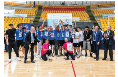
Il Labriola festeggia il ritorno alla vittoria dopo 10 anni