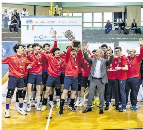
UNA FESTA La squadra maschile di Roma, vincitrice in finale contro Viterbo